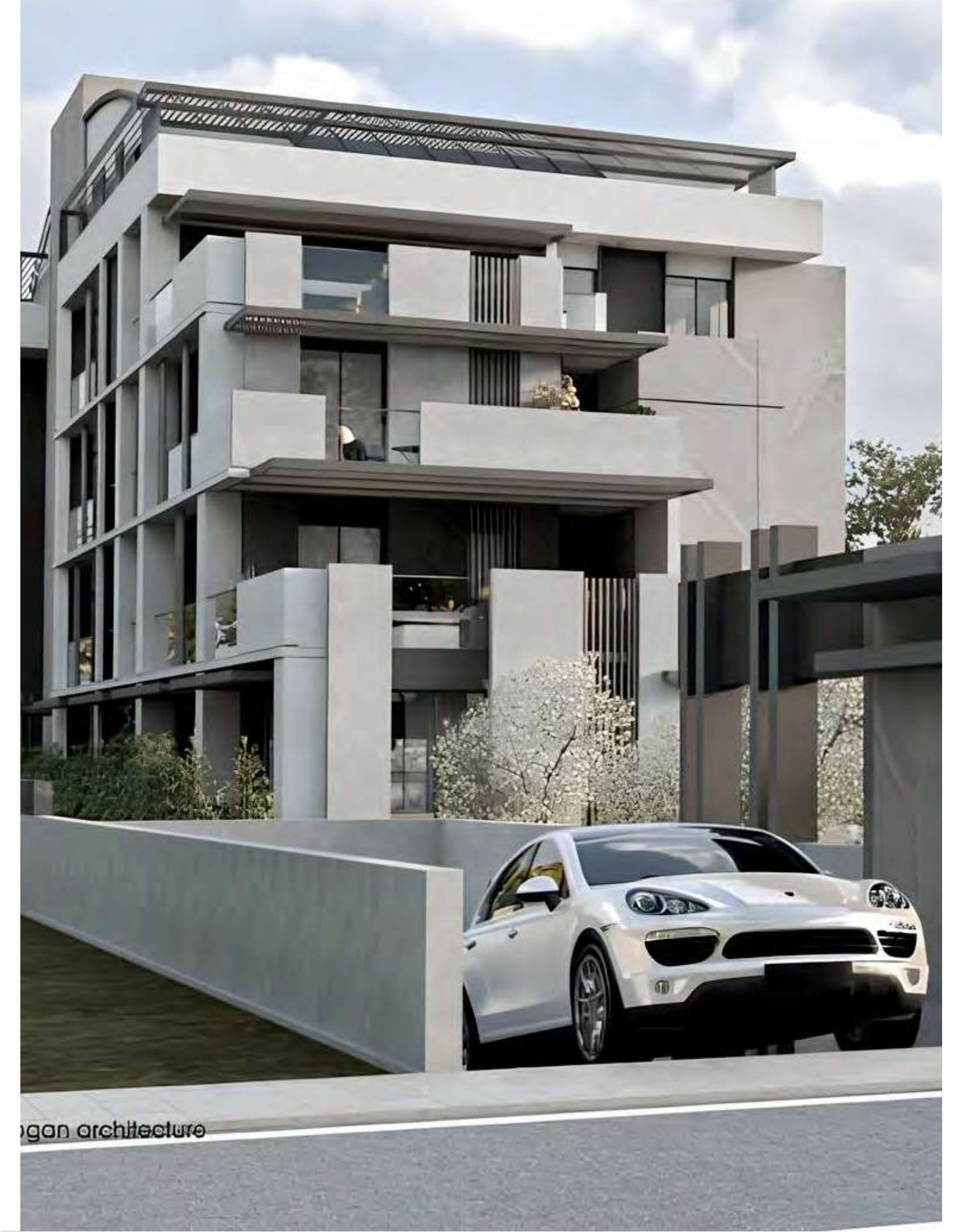
*Gürka Mimarlık Prelude Evleri