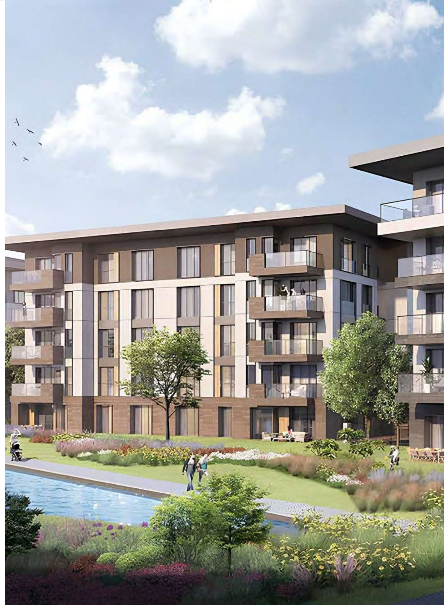
*Tema İstanbul 2