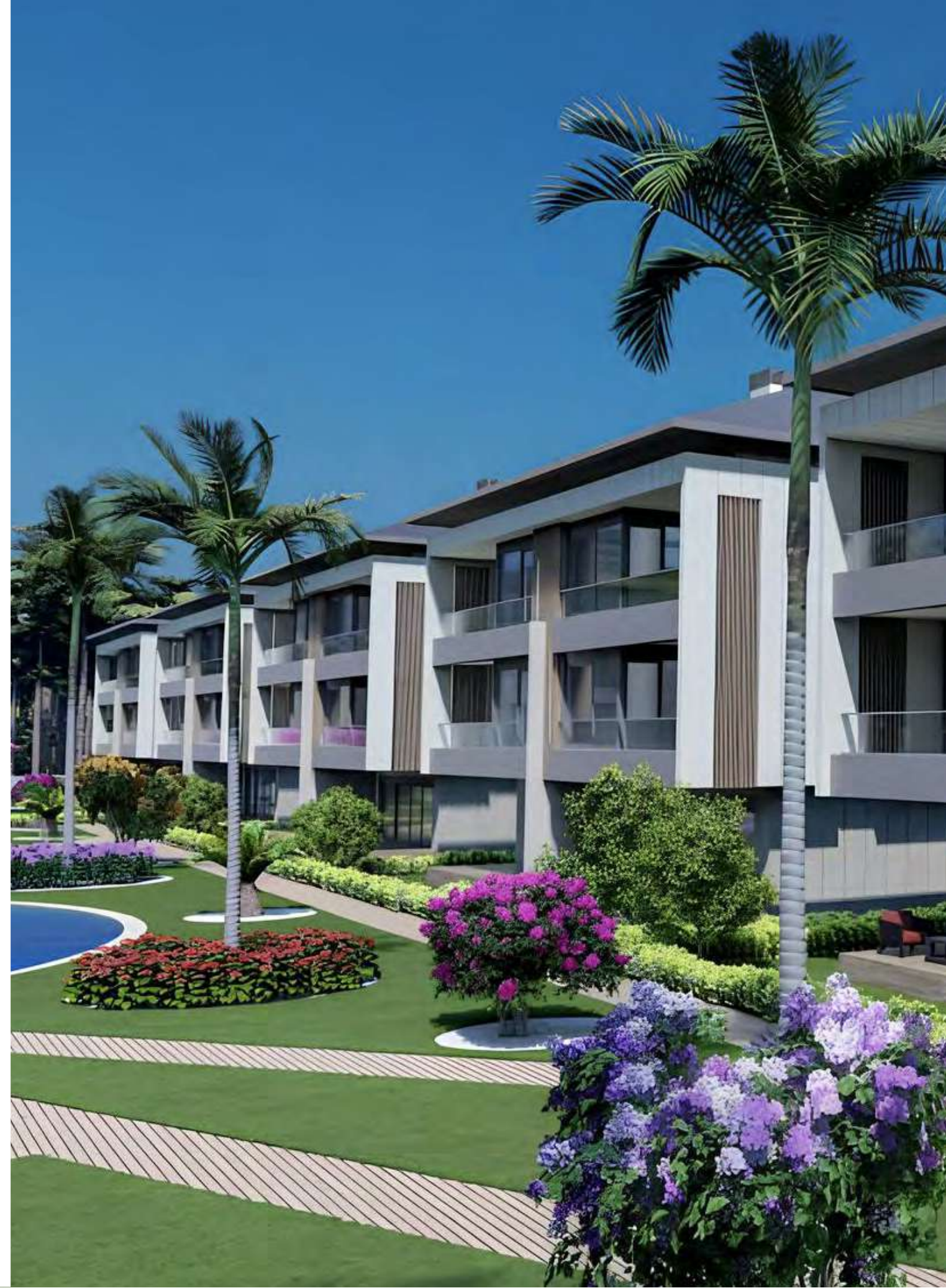
*Catta Villa Premium İnşaat